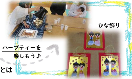
ひな飾り ハーブティーを 楽しもう♪

※予約日であっても、キャンセル等で当日参加出来ることもあります。ご連絡ください(*~*) ※予約受付時間は、 月～金 10時～15時 です。 お待ちしております★